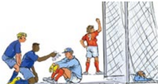
Cartoon: Burkhard Pfeifroth, Reutlingen